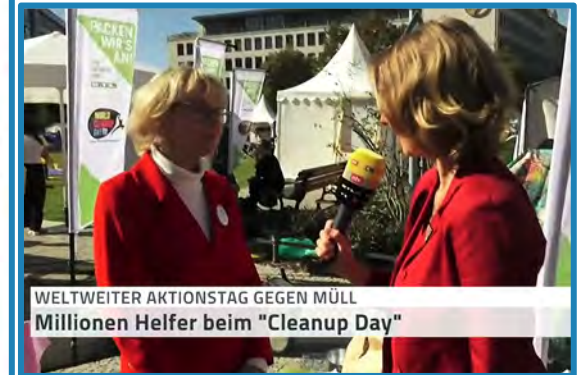
WELTWEITER AKTIONSTAG GEGEN MÜLL Millionen Helfer beim "Clean up Day"