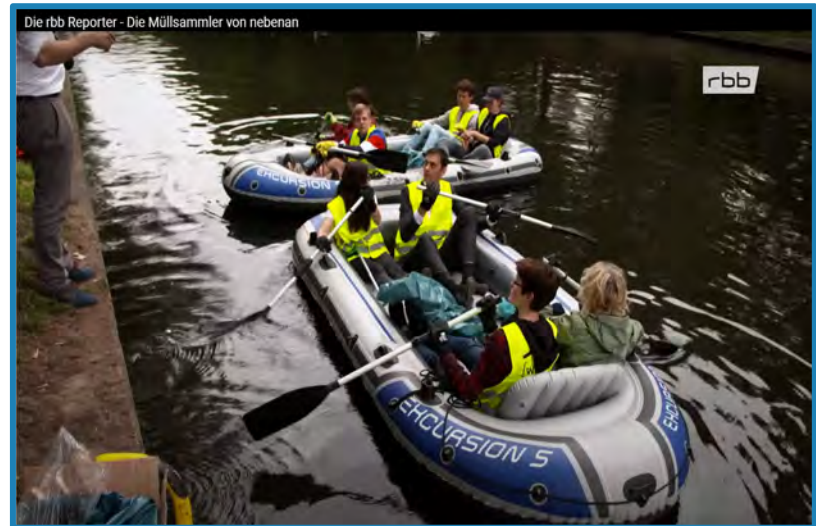
RBB, Die rbb Reporter - Die Müllsammler von nebenan, 08.10.2019